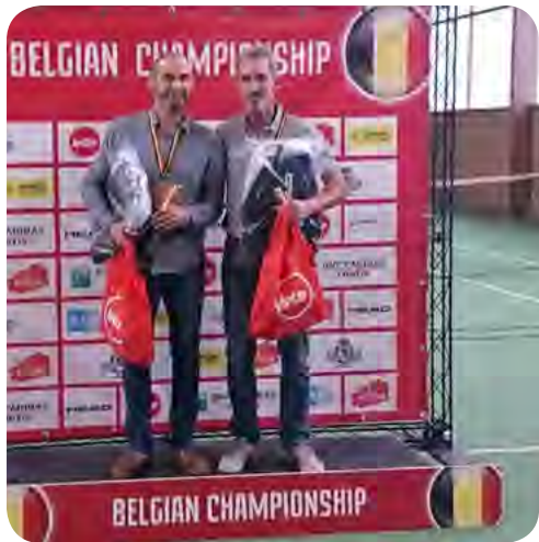
Notre champion de Belgique !